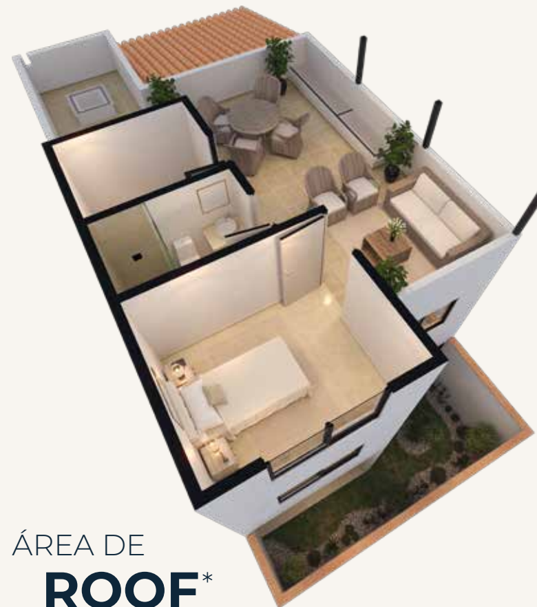
ÁREA DE ROOF*