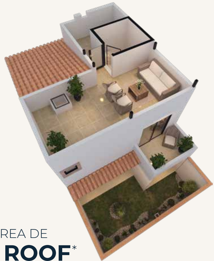
ÁREA DE ROOF*